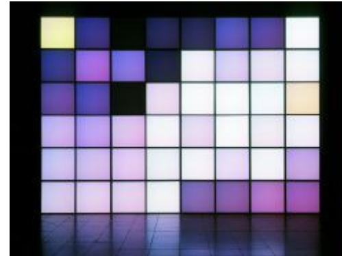
Figura 2: Z Point

películas de Antonioni Blow-up y Zabriskie Point Bulloch construye sus obras: Blow Up_TV y Z Point . Para nuestro propósito nos es particularmente interesante Z Point ya que podemos considerar esta pieza el origen conceptual de Horizontal Technicolour: Stills with Negative Spaces .