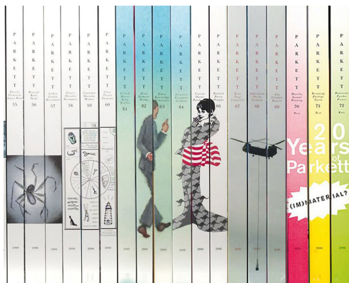
Figura 4: Lomos de la revista Parkett entre los que se incluye el nº 66 con la obra de Angela Bulloch

En Horizontal Technicolour: Stills with Negative Spaces Bulloch trasladó todas estas cuestiones al formato de la fotografía digital, en este caso un C-print. Si bien queda clara la operación de desinformación y descontextualización que se produce con la reducción digital de una imagen al abstraerla a las unidades básicas que la conforman, los píxeles, al ser un formato estático no permite una interacción, a mi juicio, tan potente como las instalaciones de las que deriva y que opera en un nivel más profundo al añadir sonido e imagen en movimiento, por llamar de alguna forma al bucle cromático.